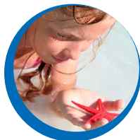
Traitement de l'eau